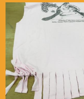
Atar la franja en nudos