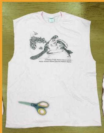
Cortar las mangas