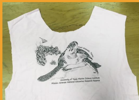
Cortar el collarín