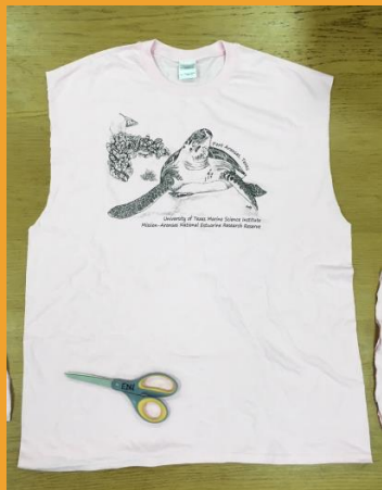
Remove the sleeves