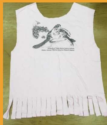
Cortar la franja