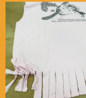
Tie fringe in knots, closing the bottom of the t-shirt